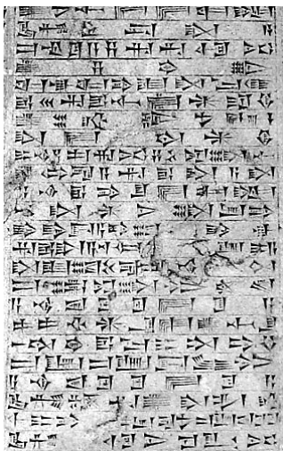
A. klínové písmo