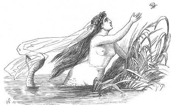
B. Malá mořská víla