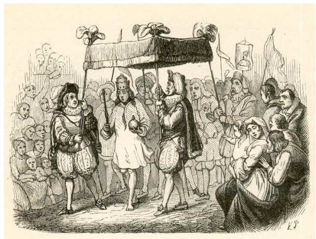
D. Císařovy nové šaty