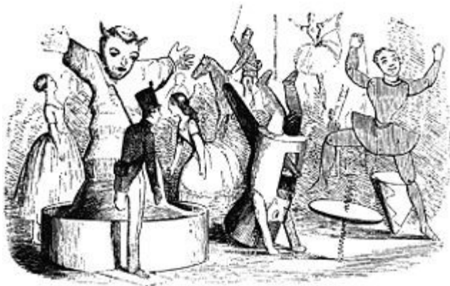
C. (Statečný) Činový vojáček